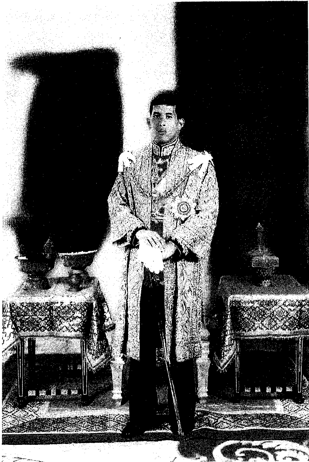
พระฉายาลักษณ์สมเด็จพระเจ้าอยู่หัว