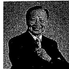
ศ.ดร.บพ.กระแส ชนวงค์ ภาวะผู้นำทางกาเมืองและ การปกครองท้องถิ่น