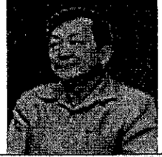
มศ.ดร.ภพ.ประสงค์ เต็มชวลา ยุทธศาสตร์การปฏิรูปโครงสร้างกับ นโยบายในยุคประเทศไทย 4.0